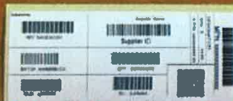
Etiquette UC / CU LABEL