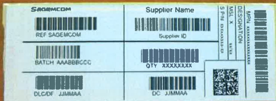
Etiquette Carton / Box LABEL