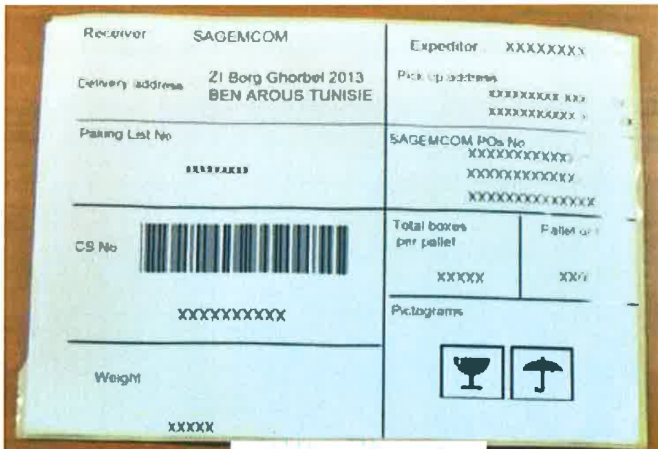
Etiquette UM / HU LABEL