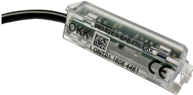
Bild 1 : Der Kommunikationsadapter SMARTY ix-BAB-EDL-OKK für Steckzähler mit EDL-Standard